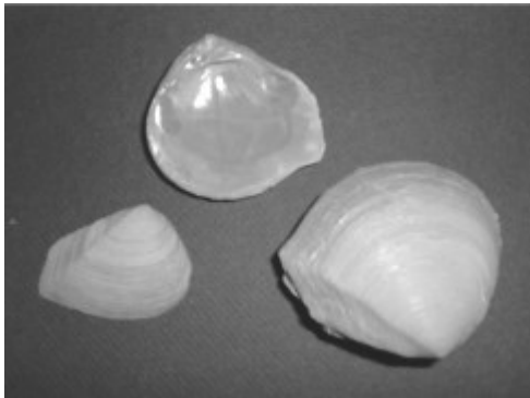
Crassatella Dilatata - 4,5 cm