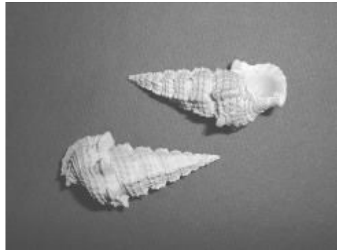
Pyrazus Angulatus - 4,5 cm