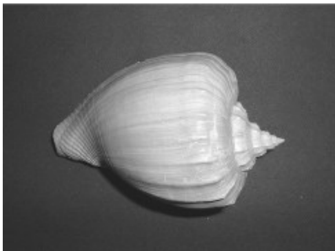
Athleta Ventricosa - 10cm